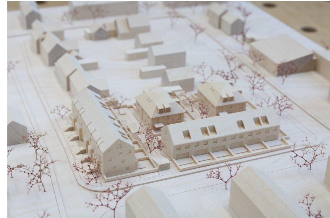
Holzmodell, Jahn Coleur